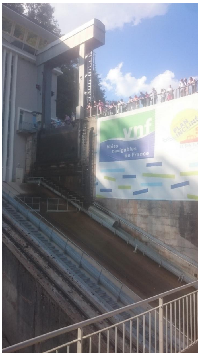
Eigentlich gar nicht aufregend.

Irgendwie finden wir die Sonnenhelle beruhigend, als wir endlich aus der Unterwelt wieder auftauchen.